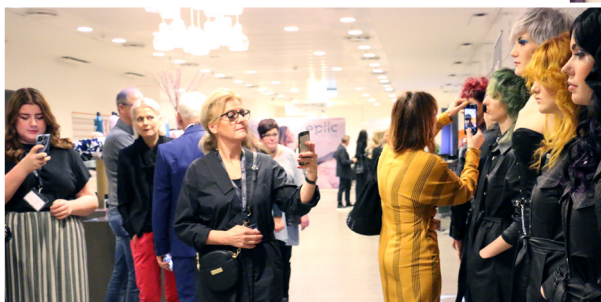
Modeller betragtes og fotograføres ivrigt i lobbyen